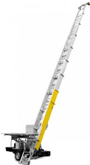
monte charge automatisé